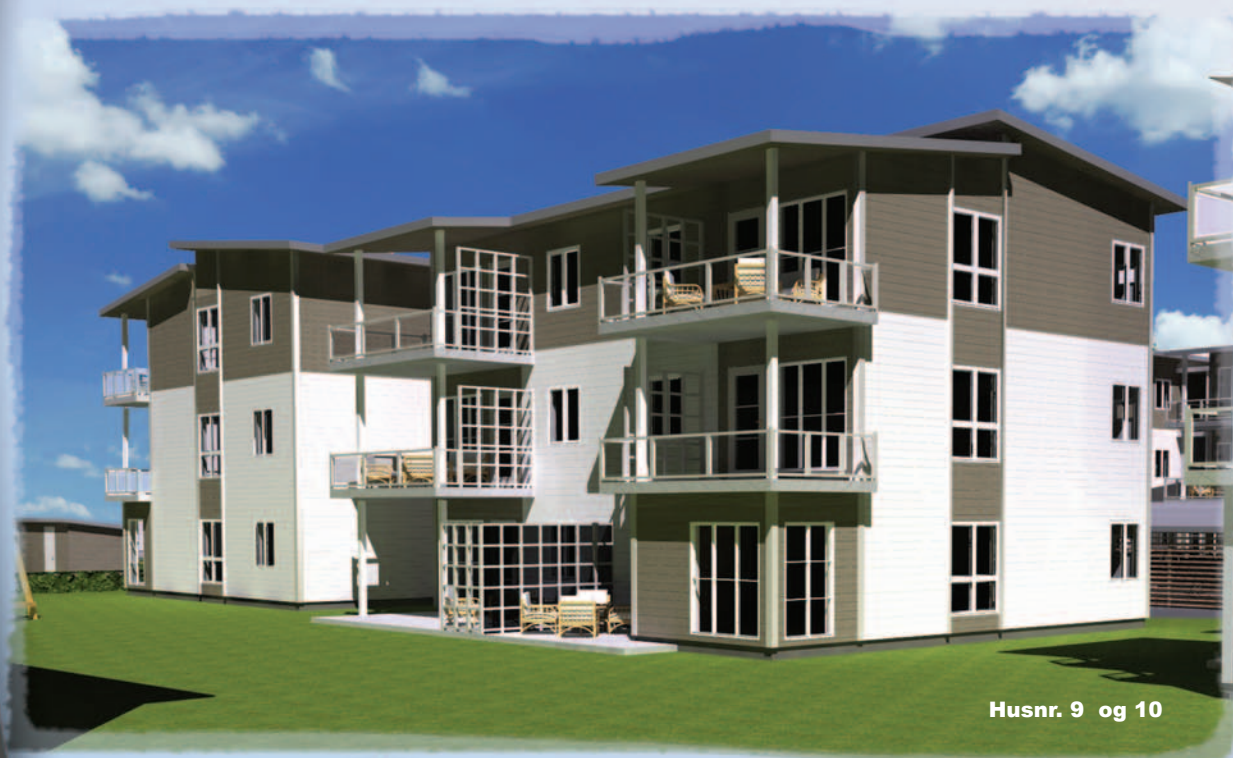
Husnr. 9 og 10