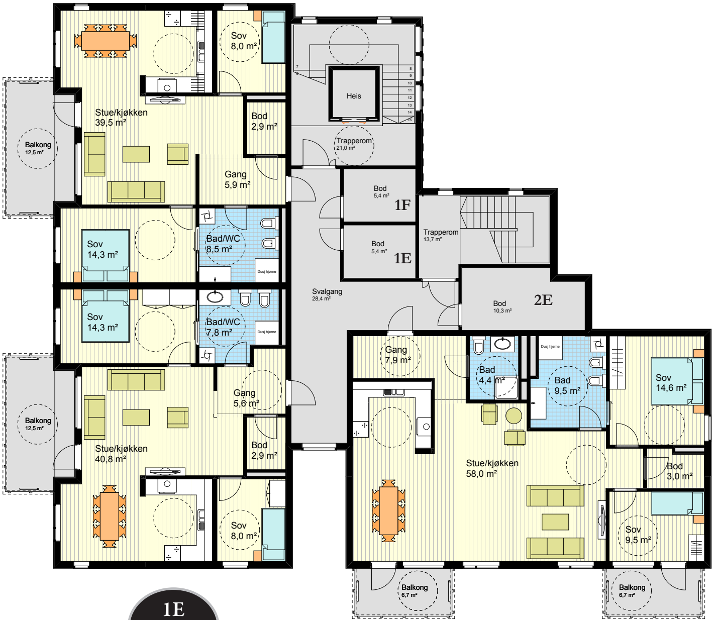
1E BRA 83 m 2 P-rom 80 m 2